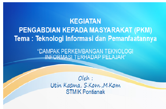
Gambar 1. Slide Show Materi Seminar

Pelaksanaan kegiatan seminar ini diawali dengan presentasi materi yang terkait dengan dampak perkembangan teknologi informasi. Penyampaian materi tidak terbatas dari apa yang sudah disiapkan dalam slide PPT, tapi penulis juga mempraktekan contoh yang relevan dengan dampak positif dan dampak negatif dari perkembangan teknologi informasi. Penyampaian contoh-contoh ini bertujuan agar peserta seminar semakin memahami dampak penggunaan teknologi informasi. Salah satu contoh dampak positifnya yaitu dengan menggunakan media internet sebagai mesin pencari untuk mendukung pelajar dalam mencari berbagai informasi yang dibutuhkan untuk menunjang proses belajar, hal ini karena informasi yang dibutuhkan akan semakin cepat dan mudah di akses. Sementara untuk dampak negatif, contoh yang disajikan adalah munculnya tingkat kemalasan yang tinggi dari siswa, hal ini dikarenakan teknologi informasi mengakibatkan orang untuk berpikir pendek dan bertahan konsentrasi dalam waktu yang singkat, karena tergantung pada alat yang digunakan.