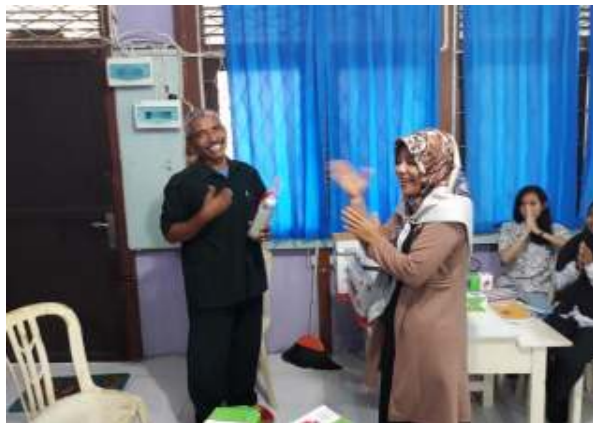
Gambar 4. Tanya jawab dengan wakil Kepala Sekolah

Pada gambar 4, merupakan gambar proses tanya jawab pada saat presentasi materi. Wakil kepala sekolah sangat bersemangat dalam mengikuti kegiatan seminar ini.