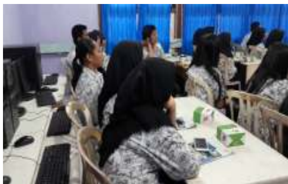
Gambar 5. Peserta seminar mengikuti kegiatan

Pada gambar 4, merupakan gambar proses tanya jawab pada saat presentasi materi. Wakil kepala sekolah sangat bersemangat dalam mengikuti kegiatan seminar ini.