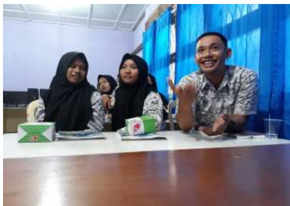
Gambar 6. Peserta seminar mengajukan pertanyaan

Gambar 5 dan gambar 6 merupakan gambar yang menjelaskan interaksi antara pemateri dengan peserta seminar. Peserta seminar diberikan kesempatan untuk bertanya lebih lanjut mengenai materi yang disampaikan.