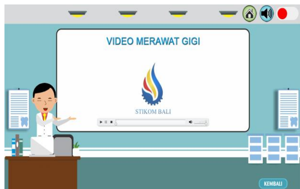
Gambar 5 Halaman Video Tentang Gigi

serta memiliki button seperti button home untuk kembali ke halaman awal, button volume untuk mematikan atau menghidupkan suara pada halaman tersebut dan button kembali untuk kembali ke halaman sebelumnya.