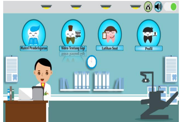
Gambar 3 Halaman Utama

Pada gambar 3 adalah Halaman Menu Utama dari aplikasi multimedia interaktif metode merawat gigi anak usia dini yang berisikan audio bendsound ukulele dan sub menu materi pembelajaran, video tentang gigi, latihan soal dan profil serta memiliki button seperti button home untuk kembali ke halaman awal dan button volume untuk mematikan atau menghidupkan suara pada halaman tersebut.