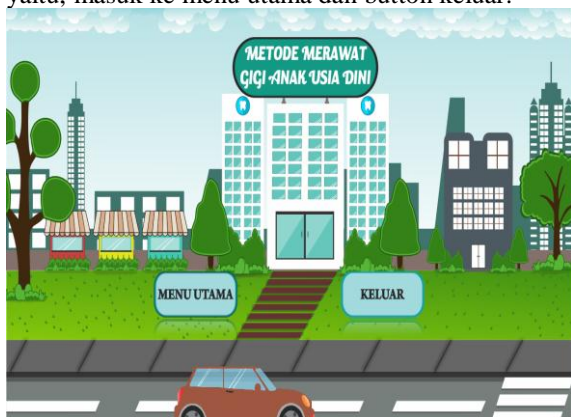
Gambar 2 Halaman Awal

Pada gambar 2 adalah Halaman Tampilan halaman awal dari aplikasi multimedia interaktif metode merawat gigi anak usia dini, halaman ini berisikan audio bendsound ukulele dan narasi serta terdapat 2 button yaitu, masuk ke menu utama dan button keluar.