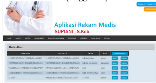
Gambar 14. Tampilan Akun User

Pada menu ini adalah berisikan data akun pengguna aplikasi rekam medis.