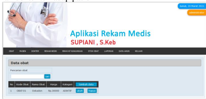
Gambar 3. Tampilan Menu Obat

Menu Obat ini adalah menu yang berisikan data stok obat yang ada dalam penyimpanan dan obat yang diberikan dokter terhadap pasien