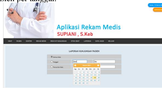
Gambar 13. Tampilan Menu Laporan

Pada menu ini adalah laporan kunjungan pasien, sehingga administrasi dapat mengetahui laporan kunjungan pasien per tanggal.