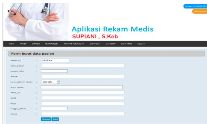
Gambar 6. Tampilan Tambah Data Pasien

Di menu tambah pasien ini administrasi dapat menambah pasien baru apabila ada pasien baru yang mau melakukan perobatan atau mengubah data pasien tersebut