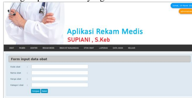
Gambar 4. Tampilan Data Obat

Di menu ini merupakan bagian dari menu obat, di menu ini administrasi dapat menambahkan atau menghapus stok obat yang ada