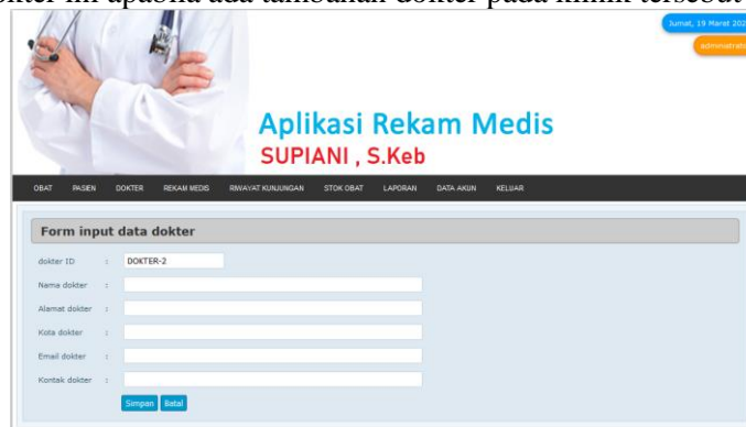
Gambar 8. Tampilan Input Data Dokter