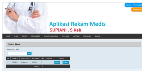
Gambar 12. Tampilan Stok Obat

Pada menu ini adalah laporan data stok obat yang tersedia pada praktek bidan, sehingga administrasi dapat mengetahui obat apa yang ready untuk diberikan kepada pasien berdasarkan diagnose dari dokter