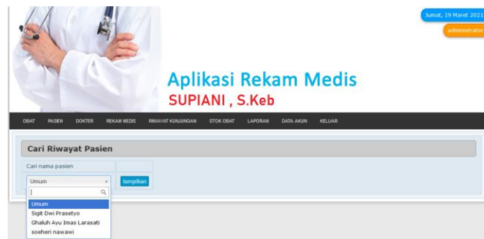
Gambar 11. Tampilan Riwayat Kunjungan

Menu riwayat kunjungan ini berisikan daftar kunjungan pasien yang berobat pada paraktek bidan mandiri, sehingga mengetahui jumlah pasien yang berkunjung dalam setiap harinya.