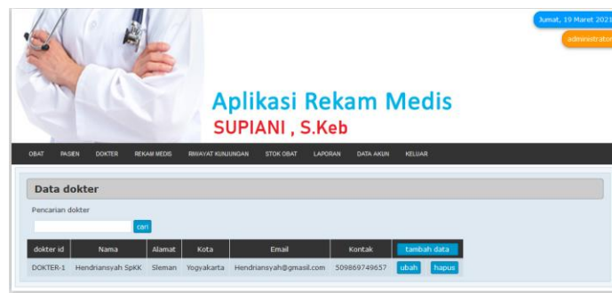
Gambar 7. Tampilan menu Dokter/Bidan