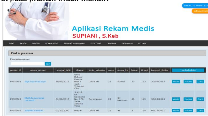
Gambar 5. Tampilan Menu Pasien

Menu pasien adalah menu yang dilakukan registrasi pada pasien pertama kali melakukan kunjungan berobat pada praktek bidan mandiri