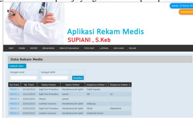
Gambar 9. Tampilan Data Rekam Medis