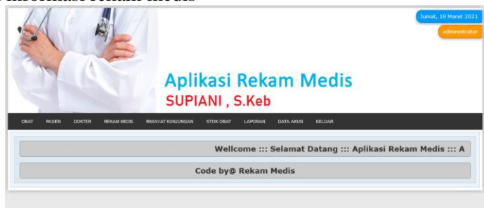
Gambar 2. Tampilan Dashboard rekam Medis