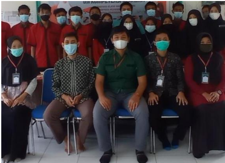
Gambar 8. Sesi Foto Bersama Pada Akhir Kegiatan

Luaran yang dicapai dari kegiatan pengabdian kepada masyarakat bagi peserta yaitu peningkatan tentang wawasan penggunaan website pada era digital sekarang ini. Peserta juga dibekali dengan ketrampilan bagaimana cara penggunaan sistem pendaftaran secara online berbasis website untuk SMA Negeri 1 Sejangkung. Disamping itu, respon positif terhadap kegiatan ini juga diberikan oleh peserta, hal ini terlihat dari pertanyaan peserta yang disampaikan pada saat diskusi. Pertanyaan tersebut mengindikasikan bahwa peserta memahami apa yang disampaikan oleh nara sumber mengenai pemanfaatan website khususnya website untuk sistem pendaftaran online bagi calon siswa di SMA Negeri 1 Sejangkung. Materi yang disampaikan juga merupakan hal yang positif bagi para peserta karena menambah pengetahuan dan wawasan baru di bidang teknologi informasi.