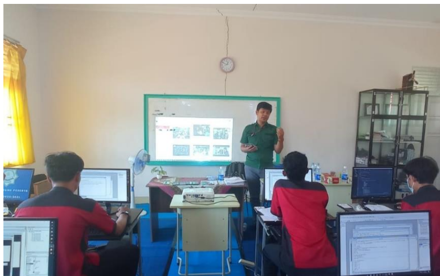
Gambar 2. Penyampaian Materi Oleh Narasumber Pada Sesi Pertama

Pada sesi pertama dari workshop ini, para peserta dikenalkan terlebih dahulu kelebihan dari penggunaan website di jaman era digital ini. Materi yang disampaikan oleh narasumber berupa sejarah perkembangan internet dan website, kelebihan kenapa menggunakan website untuk media komunikasi di era digital, dan seberapa penting sistem pendaftaran online siswa baru berbasis website untuk sekolah khususnya untuk menjangkau calon siswa yang berada jauh dari sekolah SMA Negeri 1 Sejangkung. Sesi pertama ini berlangsung selama 2 (dua) jam dimana 60 menit pertama digunakan untuk penyampaian materi secara ceramah oleh narasumber. Peserta yang terdiri dari guru, staf dan perwakilan siswa dari tiap kelas begitu antusias mendengarkan narasumber menyampaikan materi (gambar 2).