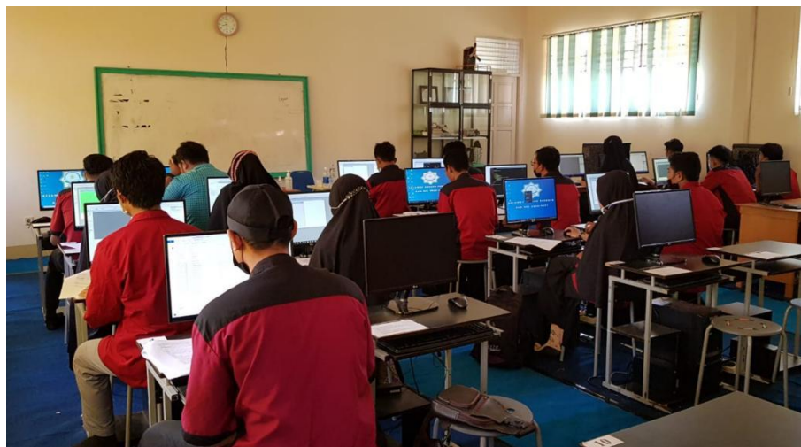
Gambar 6. Suasana Pada Saat Peserta Mulai Mencoba sistem pendaftaran online siswa baru sistem pendaftaran online siswa baru

setelah melakukan proses pendaftaran, para peserta akan masuk ke dalam halaman form data pribadi. Pada halaman ini peserta mengisi biodata diri dengan berpura-pura sebagai calon siswa yang akan mendaftar ke SMA Negeri 1 Sejangkung. Banyak data yang harus di isi untuk keperluan administrasi pendaftaran siswa, seperti contohnya nama, alamat, NIK seperti yang ada di kartu keluarga, jenis kelamin, tanggal lahir, tempat lahir, agama, asal sekolah, nilai raport SMP dan informasi lain yang mendukung calon siswa di SMA Negeri 1 Sejangkung (Gambar 7).