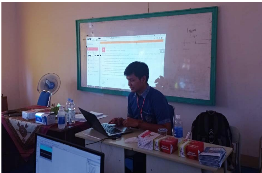
Gambar 4. Narasumber Menyiapkan Materi Untuk Sesi Kedua

Pada sesi keduanya, para peserta dipersilahkan untuk mengakses website dari sistem pendaftaran online siswa baru SMA Negeri 1 Sejangkung yang telah dijalankan di jaringan LAN pada laboratorium komputer di SMA Negeri 1 Sejangkung. Pada pertama para peserta mengakses, halaman yang muncul adalah halaman pendaftaran yang mewajibkan para calon siswa baru untuk memasukkan email dan password dan kemudian menekan tombol “Daftar” pada halaman website sistem pendaftaran online siswa baru (Gambar 5).