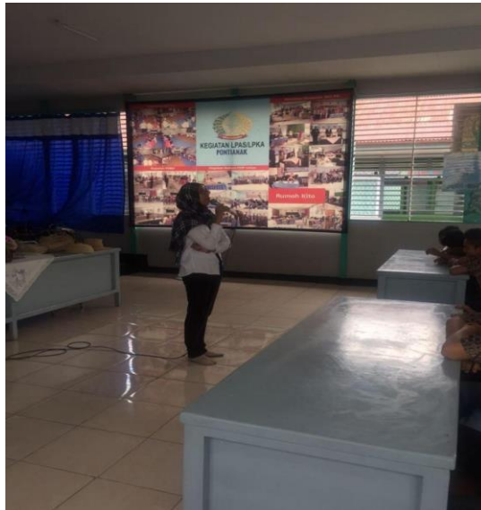
Gambar 7. Pembacaan doa dan Penutupan Acara Pelatihan

semua berjamaah di masjid lapas di imami oleh salah satu anak asuh yang ternyata berlatar belakang pesantren. Sungguh pengalaman yang luar biasa dalam melaksanakan pengabdian kepada masyarakat di LPK Anak TK II Pontianak. Pengalaman yang tidak akan mungkin bisa terlupakan karena kesan yang diperoleh jauh dari bayangan terhadap warga binaan yang memiliki konotasi negative dimata masyarakat.