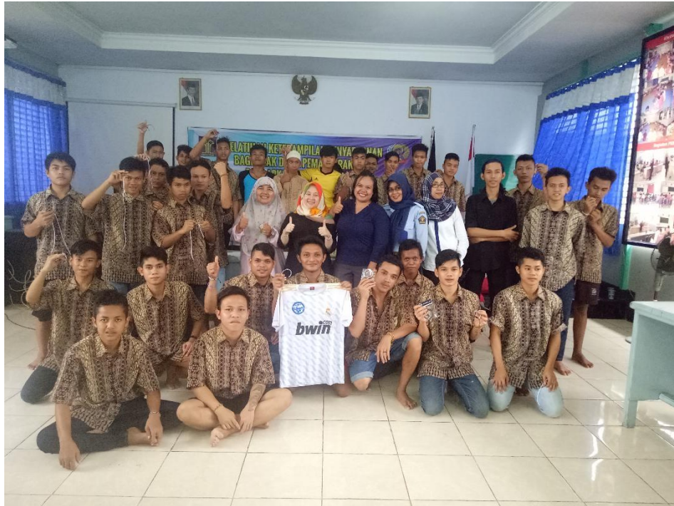
Gambar 7. Peserta Selesai Pelatihan

Bagian yang paling mengharukan adalah ketika kami melakukan sesi foto bersama untuk mengabadikan momen kegiatan yang berkesan. Sudah tidak ada rasa canggung yang tim pelaksana rasakan terhadap anak-anak warga binaan. Selepas kegiatan beberapa orang peserta menghampiri untuk mengucapkan salam perpisahan dan ucapan terima kasih. Akhirnya kegiatan berjalan dengan sukses dan semoga memberikan kontribusi positif kepada anak-anak binaan di Lembaga Pemasyarakatan Khusus Anak TK II Pontianak. Harapan besar sangat di nantikan dari seluruh peserta pelatihan ketika mereka telah keluar dari lembaga pembinaan agar tidak terjerumus kembali ke dalam kehidupan kriminal yang pada akhirnya menghantarkan mereka kembali masuk ke dalam lembaga. Berharap menimbulkan dampak positif dan kreatifitas tinggi tim pelaksana pelatihan memberikan harapan jika kelak telah keluar dari lembaga pembinaan tim bersedia untuk memberikan ruang dalam melatih ketrampilan menganyam gelang lebih lanjut dan tanpa dipungut biaya kepada seluruh warga binaan dan pernyataan tersebut disambut dengan antusiasme yang sangat besar dari seluruh peserta dan didukung pula oleh para pengasuh dan Pembina.