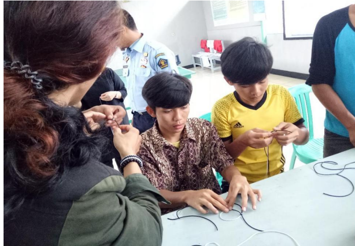
Gambar 4. Proses Menganyam Gelang

berada pada deskripsi yang disampaikan secara langsung pada proses pelatihan untuk membuat kesan yang terlalu kaku ketika kegiatan berlangsung.