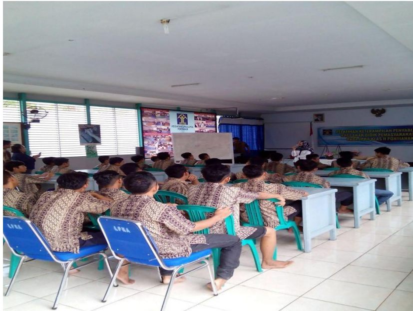
Gambar 5. Peserta Pelatihan

Peserta pelatihan mengenakan pakaian seragam yang menunjukkan betapa mereka adalah anak-anak yang tertib dan sangat kooperatif. Dijelaskan juga dalam sebuah penelitian yang mengutip mengenai sistem pemasyarakatan tidak hanya sekedar pada rehabilitasi dan resosialisasi akan tetapi lebih mengarah pada unsur edukasi, korelasi dan defenitif sehingga berdampak secara nyata pada aspek individu terkait dan sosial pada umumnya sesuai dengan filsafah pancasila sebagai pedoman hidup bangsa Indonesia [9]. Kerjasama terjalin baik pada setiap sesi acara pelatihan yang diberikan sehingga membuat tim pelaksana pelatihan menjadi semakin bersemangat dan terpacu untuk memberikan kontribusi positif kepada para anak asuh di Lembaga Pemasyarakatan Khusus Anak di kota Pontianak.