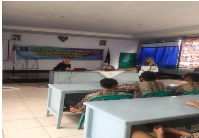
Gambar 1. Pembukaan Acara Pelatihan

orang anak binaan yang berjenis kelamin perempuan tidak ikut dalam acara pelatihan dengan alasan malu dan merasa tidak nyaman untuk ikut bergabung dan kami selaku penyelenggara berusaha mengerti mengenai psikologi anak yang merasakan ketidaknyamanan akan keberadaan orang asing di lingkungan lembaga. Pada saat jeda sholat tim pelaksana pelatihan meminta izin untuk menemui anak perempuan tersebut dan diijinkan. Berdasarkan izin dari yang bersangkutan kami melakukan sedikit percakapan sederhana sekedar untuk mengucapkan salam kenal dan mendengarkan informasi dari Pembina mengenai latar belakang narapidana wanita tersebut. Hal yang disampaikan cukup menimbulkan kesan mendalam dan semakin menguatkan tim untuk memberi kontribusi pelatihan yang berdaya ekonomi sehingga dapat menjadi bekal dikemudian hari. Walau tidak dapat berinteraksi secara langsung menurut kami sudah diijinkan untuk bertemu saja itu sudah cukup, karena bagaimanapun juga kami selaku tim pelaksana harus menghormati setiap privasi yang dimiliki oleh anak-anak dilembaga binaan.