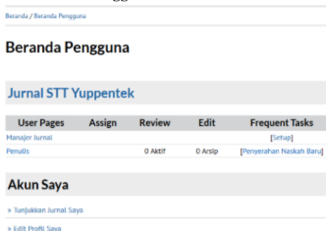
Gambar 8. Tampilan Beranda Pengguna