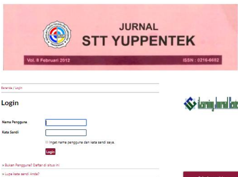
Gambar 5. Form Login