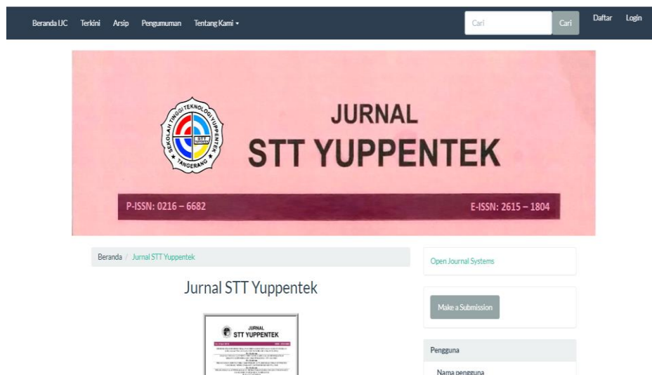
Gambar 4. Tampilan Home