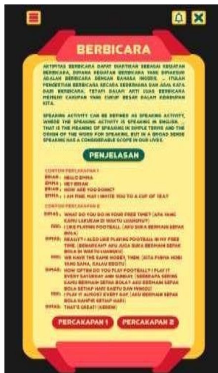
Gambar 6. Tampilan Menu Berbicara

Tampilan Menu belajar Berbicara menampilkan bahwa dalam berbicara dengan bahasa Inggris dimana dicontohkan dalam bentuk dua percakapan antara dua orang dalam bentuk suara dan teks bahasa Inggris. Untuk kembali ke menu utama dapat memilih icon garis tiga kiri atas yang dapat dilihat pada Gambar 6.