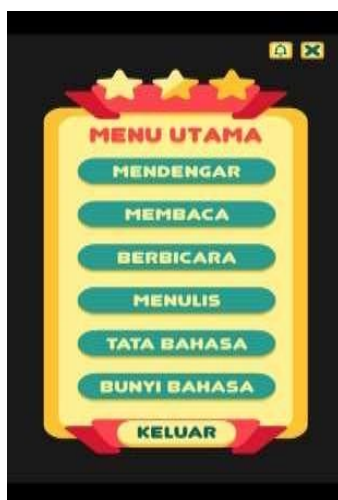
Gambar 3. Tampilan Menu Utama