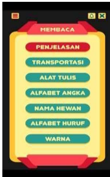
Gambar 5. Tampilan Menu Membaca