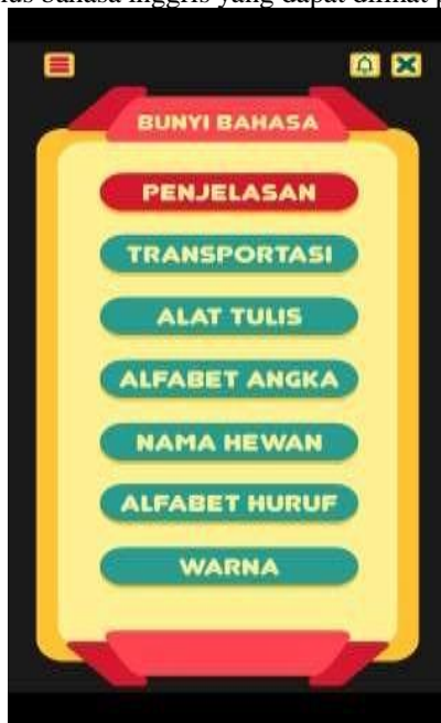
Gambar 9. Tampilan Menu Bunyi Bahasa

Tampilan Menu belajar Bunyi Bahasa menampilkan beberapa isi materi belajar kosakata dalam bahasa Inggris yang terdiri dari penjelasan, transportasi, alat tulis, alfabet angka, nama hewan, alfabet huruf, dan warna yang mana dalam isi materi masing-masing berisikan teks seperti ejaan kosakata bahasa Inggris beserta artinya seperti kamus bahasa Inggris yang dapat dilihat pada Gambar 9.