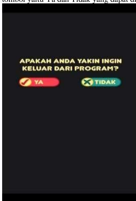
Gambar 10. Tampilan Menu Exit

Halaman Menu ini Menampilkan bagaimana ketika ingin keluar dari aplikasi, dimana user dapat memilih icon silang dipojok kanan atas dan akan ditampilkan pertanyaan apakah ingin keluar dari aplikasi atau tidak. Terdapat dua pilihan tombol yaitu Ya dan Tidak yang dapat dilihat pada Gambar 10.