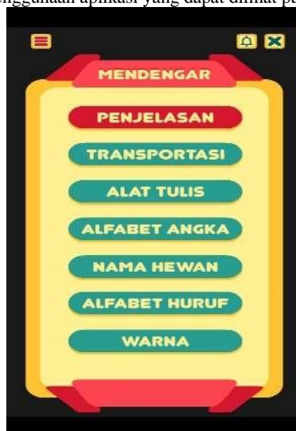
Gambar 4. Tampilan Menu Mendengar

Tampilan Menu belajar Mendengar menampilkan beberapa isi materi belajar kosakata dalam bahasa Inggris yaitu terdiri dari, penjelasan, transportasi, alat tulis, alfabet angka, nama hewan, alfabet huruf, dan warna yang berisikan gambar dan audio. Pada tombol volume, exit dan tombol garis tiga adalah sebagai bantuan dalam penggunaan aplikasi yang dapat dilihat pada Gambar 4