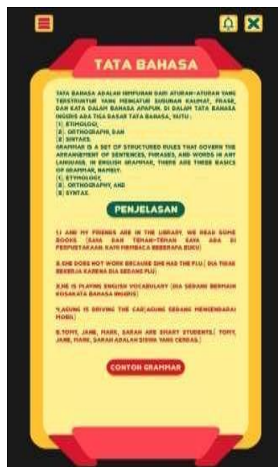
Gambar 8. Tampilan Menu Tata Bahasa

Tampilan Menu belajar Tata Bahasa ini menampilkan penjelasan pengertian dari tata bahasa (Grammar) dan pada tampilan dari menu tata bahasa ini menampilkan beberapa icon yang berisikan sebuah contoh grammar dan beberapa kuis didalam tombol contoh grammar yang dapat dilihat pada Gambar 8.