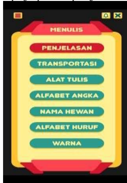
Gambar 7. Tampilan Menu Menulis

Tampilan Menu belajar Menulis menampilkan beberapa isi materi belajar kosakata dalam bahasa Inggris yang terdiri dari penjelasan, transportasi, alat tulis, alfabet angka, nama hewan, alfabet huruf, dan warna yang mana berisikan tebak gambar. Pada tombol volume, exit dan tombol garis tiga adalah sebagai bantuan dalam penggunaan aplikasi yang dapat dilihat pada gambar 7.